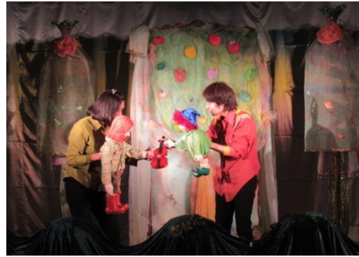
H28.5.12 劇団鑑賞会(劇団なるにあ)「うかれバイオリン」では迫力のある劇にきぎ付け☆ホールには笑い声が響いていました。