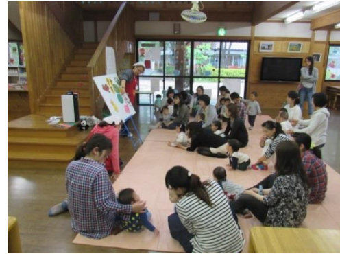
H28.5.17 親子で楽しもう(0.1歳児)パネルシアター☆いろいろな動物さんたちを夢中で見ていましたよ