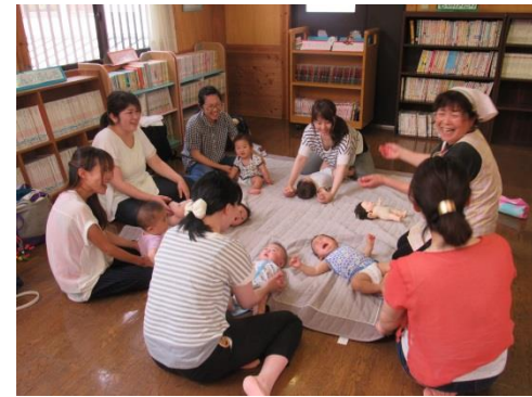
H28.5.24 親子で楽しもう(0歳児)少人数制の講座のため和やかな雰囲気の中でたくさん触れ合っていた30分でした。