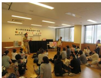
「なぞなぞどうぶつえん」飼育員さんのなぞなぞに元気いっぱいこたえていたお友だちでした!