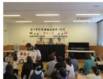
♪おべんとうバス みんなでおおきなお弁当を作り♪バスに乗ってお出かけしました