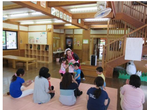
H28.5.19 親子で楽しもう(2.3歳児)エフロンシアター☆みんなで力を合わせて大きなカフを抜きました♪