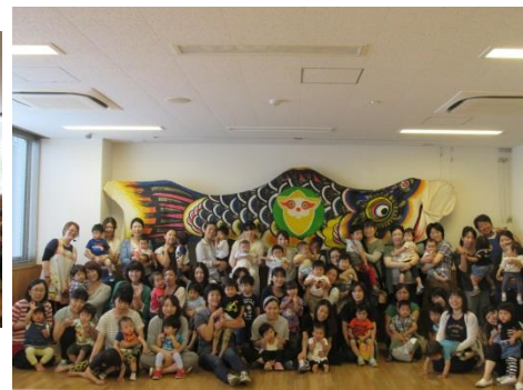
H28.5.27 すくっ子(三俣コミュニティセンター)大きな鯉のぼりと一緒に記念撮影!!