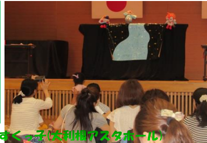
H28.7.15 出前児童館みつまたすくっ子(大和橋アスタール)

1クール最後のすくっ子でし た! 雨の中、たくさんのお友達 が遊びに来てくれました。 七夕のお話や、タンграм、 みんなの大好きなアンパンマン たちも遊びにきて楽しい時間 を過ごしました♪