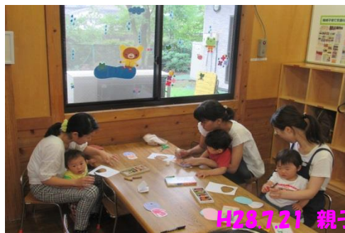
H28.7.21 親子で楽しもう(0・1歳児)