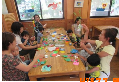
H28.7.7 親子で楽しもう(2・3歳児)

七夕の日の講座☆☆折り紙を切ったり、のりで貼 りつけたいしてかわいい七夕飾りを作りました!