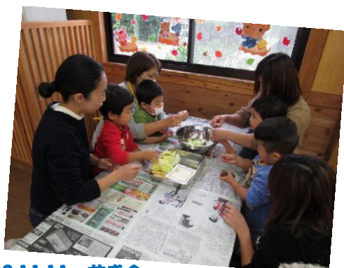
H28.11.11 芋煮会 豆腐・白菜・こんにゃく・油揚げ…たくさんの 具材を手でちぎって芋煮のお手伝い!!アツアツの芋煮をみんなで食べたよ!