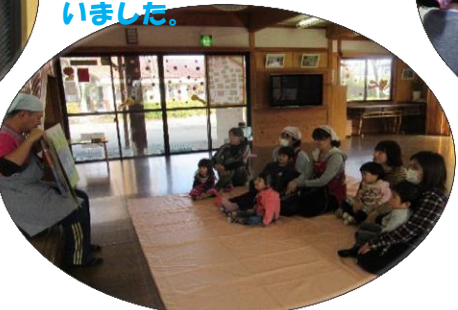
H28.11.22 親子で楽しもう(2.3歳児) 読書の秋…ということで絵本の読み聞かせをしました。みんなママの前に座りよく聞いていました。