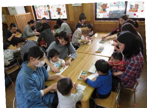
H28.11.10 親子で楽しもう(0.1歳児) 牛乳パックで「お散歩バック」を作りました。 クレヨンで絵を描いたり、指スタンプで模様をつけました。