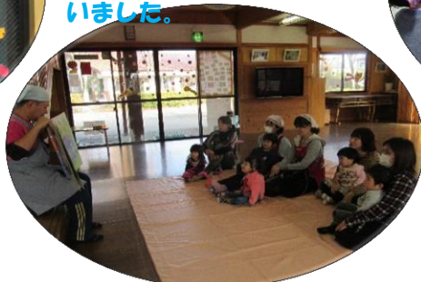
H28.11.22 親子で楽しもう(2.3歳児) 読書の秋…ということで絵本の読み聞かせをしました。みんなママの前に座りよく聞いていました。