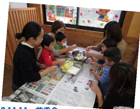
H28.11.11 芋煮会 豆腐・白菜・こんにゃく・油揚げ…たくさんの 具材を手でちぎって芋煮のお手伝い!!アツアツの芋煮をみんなで食べたよ!