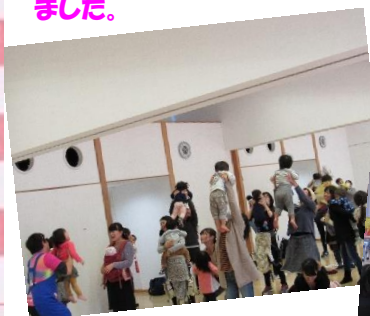
H28.10.6 すくっ子(不動岡コミュニティセンター) 絵本「いもほりバス」の劇遊びをしました!お友達もバスやねずみさんと一緒にいも掘りをしたよ!触れ合い遊びで体も心もぽっかぽか!