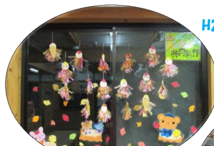
H28.11.5 みつまたおやこ秋まつり 地域のお友達の共同製作を児童館に飾りました! その他にもいろいろな出店やすくっ子も行きました。