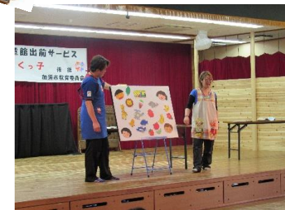
今年度最初のすくっ子! たくさんのお友達の地域のお友達や保育園のお友達が遊びに来てくれました♪アンパンマンも遊びに来てくれたよ! パネルシアターでは、いろいろな色が出てきたよ! あか・あお・きいろにみどい……みんなはどんな色がすきかな?