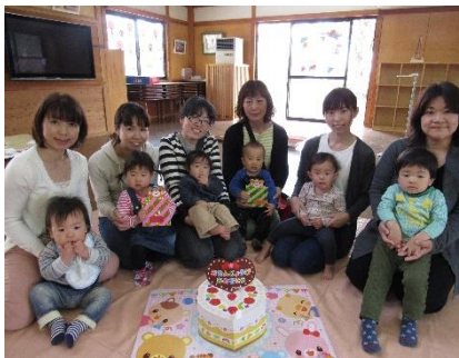
H29.4.19 27 地域お誕生会 7名のお友達とお誕生会でした♪ 手型といや身体測定をしてカードを作りました 「♪お誕生日おめでとう♪」