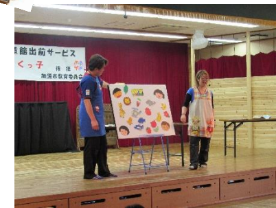
今年度最初のすくっ子! たくさんのお友達の地域のお友達や保育園のお友達が遊びに来てくれました♪アンパンマンも遊びに来てくれたよ! パネルシアターでは、いろいろな色が出てきたよ! あか・あお・きいろにみどり……みんなはどんな色がすきかな?