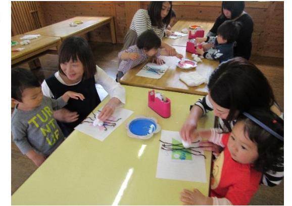
H29.4.25 親子で楽しもう2・3歳児 こいのぼり製作をしました。「ポンポン」とタオルスタンプをしてカラフルなこいのぼりが出来ました♪ 元気いっぱい体操もしましたよ!!