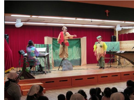
H29.4.12 音楽鑑賞会 音研さんによる「ちいさなだいぼうけん」 きれいな演奏と歌、劇、にみんな興味津々でした♪