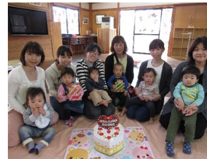
H29.4.19 27 地域お誕生会 7名のお友達とお誕生会でした♪ 手型といや身体測定をしてカードを作りました 「♪お誕生日おめでとう♪」