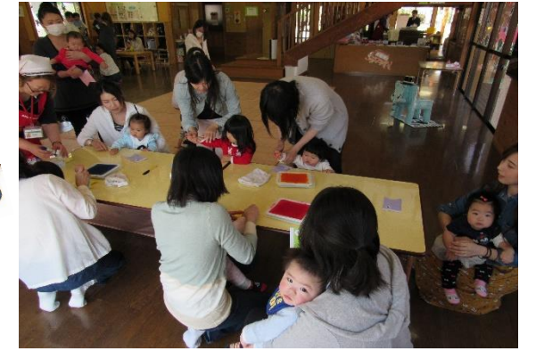
H29.4.13 親子で楽しもう0・1歳児 こいのぼり製作をしました。スタンプに触れて、自由に手型や指スタンプをしてかわいい「こいのぼり」が出来ました。