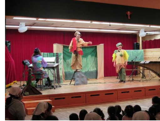
H29.4.12 音楽鑑賞会 音研さんによる「ちいさなだいぼうけん」 きれいな演奏と歌、劇、にみんな興味津々でした♪