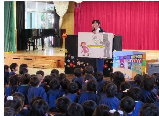
H29.4.19 防犯安全教室 おまわりさんととても大切な3つのお約束をお話してもらいました! 知らない人には、着いて行かないように気をつけようね☆