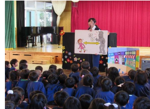
H29.4.19 防犯安全教室 おまわりさんととても大切な3つの約束をお話してもらいました! 知らない人には、着いて行かないように気をつけようね☆